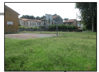
PUNTO DI RACCOLTA AREA CAMPO DA BASKET